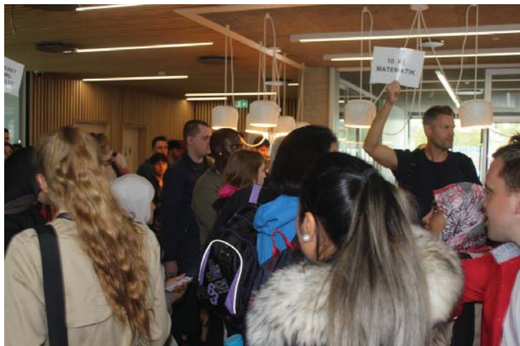
ÅBNINGSDAG: Der var både nervøsitet og spænding, da de mange nye elever skulle finde deres hold og klassekammerater, da HF og VUC åbnede i mandags.